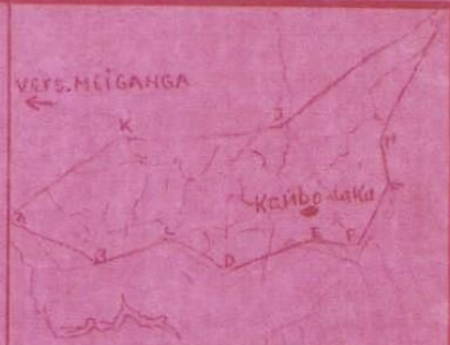
Plan de situation au 1/50.000°